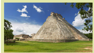
Pyramide der Magier in Uxmal

Ü/F in „The Lodge at Uxmal“ direkt neben der Tempelstadt in Uxmal www.cancunhotel2000.com/hotels/uxmal/thelodgeatuxmal.htm