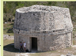
Observatorium in Mayapan