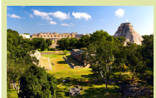
Blick über Uxmal