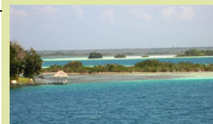
Baden im karibischen Meer

Ende der offiziellen Reise. Für diejenigen, die heute fliegen: Am Morgen evtl. noch Zeit für den Strand und mittags/nachmittags Transfer zum Flughafen, Abflug nach Hause Ü/F im Flugzeug, je nach Flugzeit auch daheim