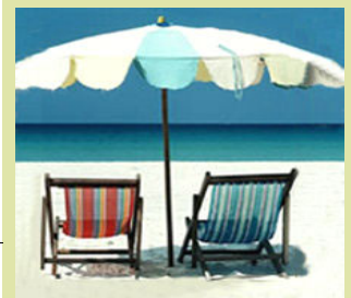
Entspannen am Strand