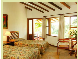
Zimmer im Hotel Villa Maya

Ü/F am wunderschönen See in Flores, Hotel Villa Maya www.villasdeguatemala.com