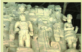
Ek-Balam, Mayastadt der Engel

Wo immer wir in Tempeln und an heiligen Stätten sind, werden wir immer versuchen, die Stellen hoher Energie und Schwingung, das Zentrum der heiligen Kraftorte zu erspüren. Wann immer sich auf der Reise die Möglichkeit bietet, werden wir bei den Tempeln in einer ruhigen Ecke meditieren oder eine Zeremonie abhalten. Es lässt sich nicht vorhersehen, wie oft das der Fall sein wird.