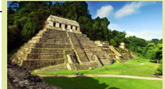
Tempel der Inschriften, Palenque

Ü/F im abgelegenen Hotel Villas Kin-Ha im Palapastil (einzelne Bungalow mit Strohdach) www.villaskinha.com