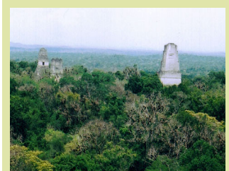
Blick über die Mayastadt Tikal