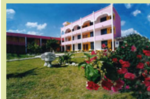
Hotel Ojo de Agua in Puerto Morelos