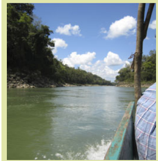
Der Fluss Usumacinta

Ü/F im abgelegenen Hotel Villas Kin-Ha im Palapastil (einzelne Bungalow mit Strohdach) www.villaskinha.com