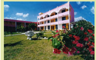
Hotel Ojo de Agua in Puerto Morelos