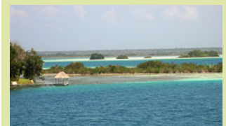
Baden im karibischen Meer