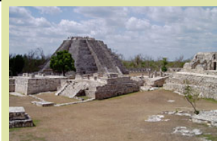
Zentrale Pyramide in Mayapan

Alternative: Wer es etwas luxuriöser haben möchte und abends gut ausgehen möchte, der kann am Beginn der Reise das Hotel ab dem 13. Tag gegen Aufpreis umbuchen und in eines der Luxushotels in Playa Carmen gehen (ab ca. 75 Euro pro Nacht).